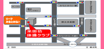
「みなとみらい駅」より1番出口徒歩3分 「新高島駅」より3番出口徒歩3分