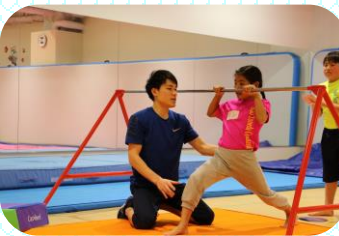
鉄棒(逆上がり)クラス